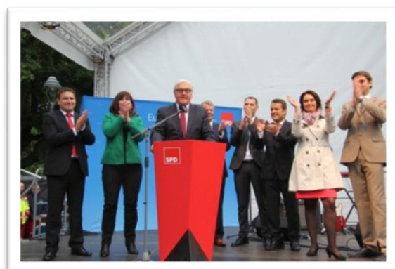
Frank Walter Steinmeier auf Europawahlkampftour in Worms Eindrücke aus der Fraktion