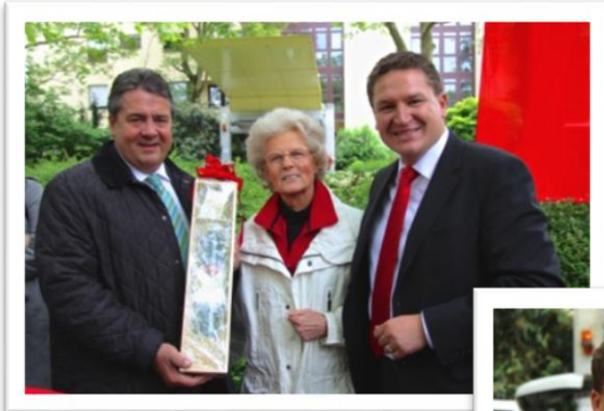
Vizekanzler Sigmar Gabriel zu Gast in Alzey, Oppenheim und Worms