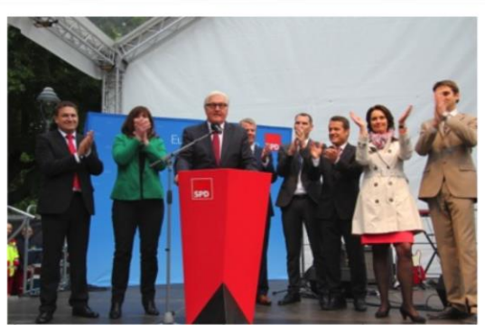
Frank Walter Steinmeier auf Europawahlkampftour in Worms