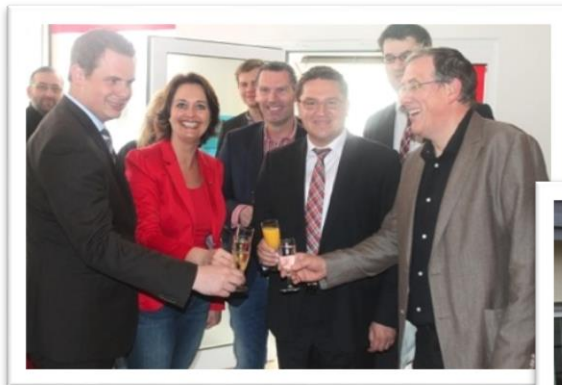
Eröffnung der Bürgerbüros in Worms, Osthofen und Alzey