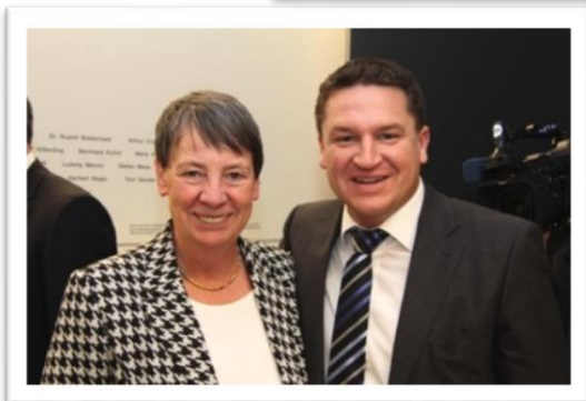
Eindrücke aus der Fraktion